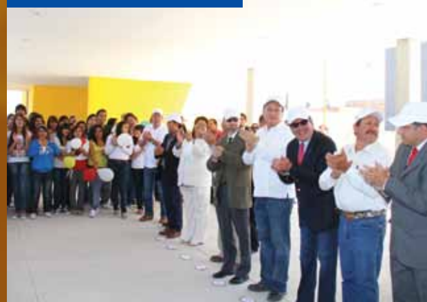
CAMPUS ORIENTE DEL CEM