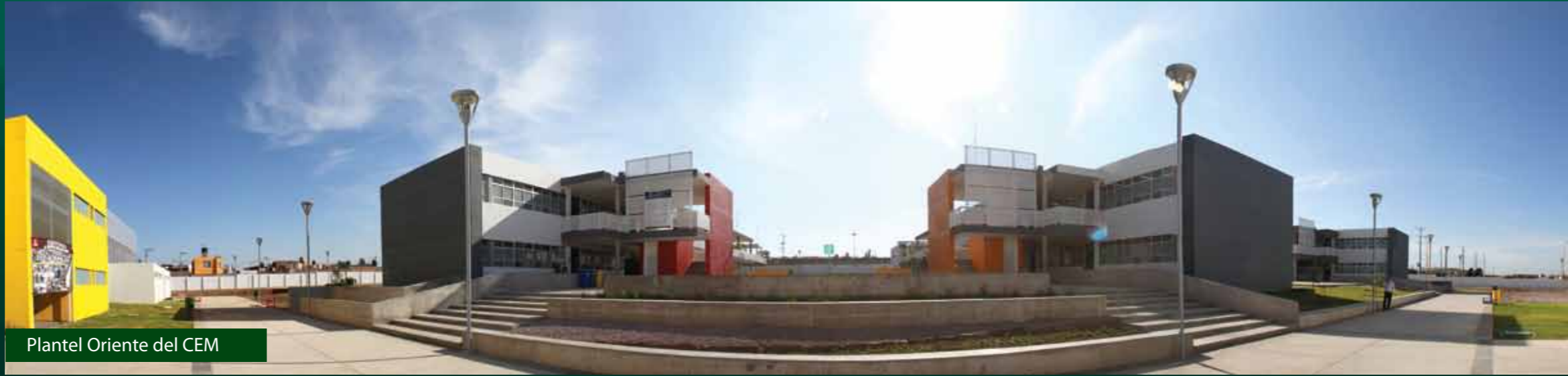
Plantel Oriente del CEM