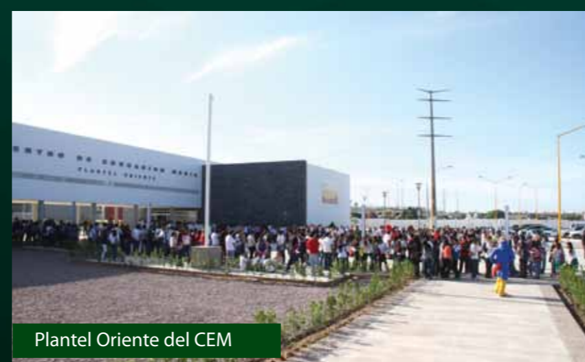
Plantel Oriente del CEM