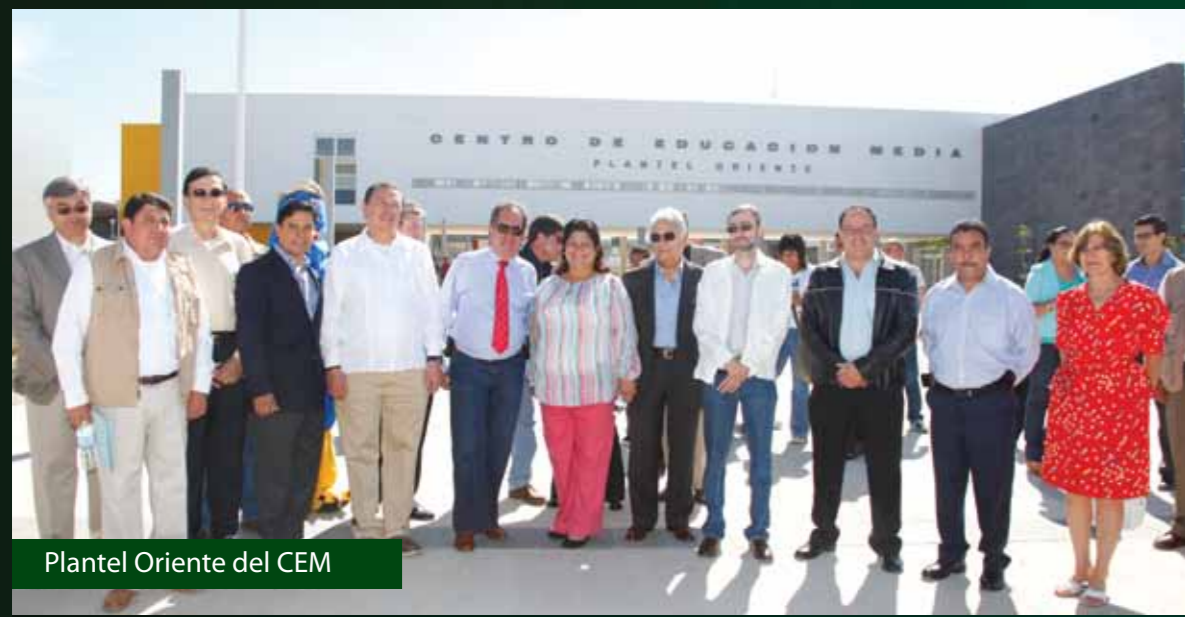
Plantel Oriente del CEM

"Estos proyectos educativos permitirán un mayor crecimiento de la oferta de espacios, pero también activar el círculo del desarrollo industrial, ya que los egresados de las nuevas carreras podrán insertarse en el mercado laboral, dentro de grandes empresas en la entidad".