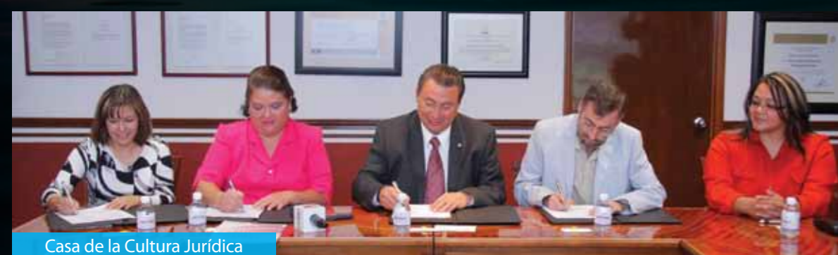
Casa de la Cultura Jurídica