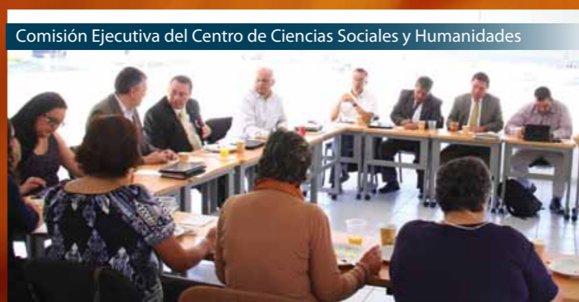
Comisión Ejecutiva del Centro de Ciencias Sociales y Humanidades