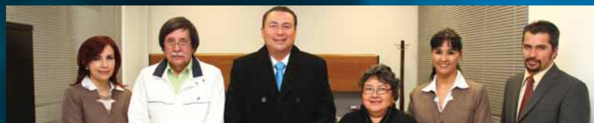
Investigación y Posgrado