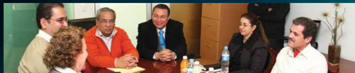
Docencia de Pregrado