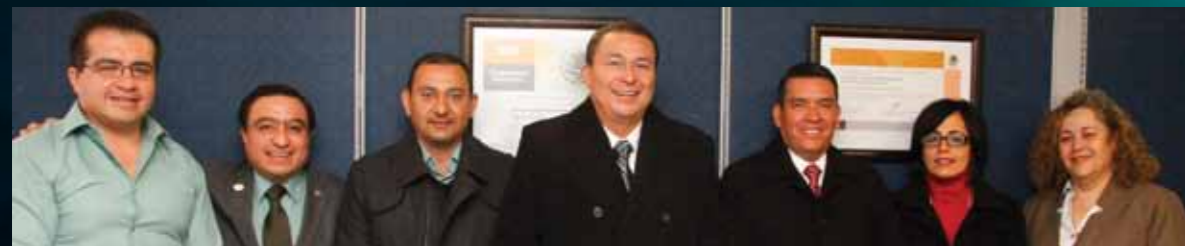
Planeación y Desarrollo