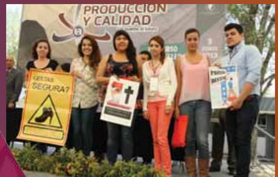
Estudiantes concluyen semestre con la presentación de proyectos