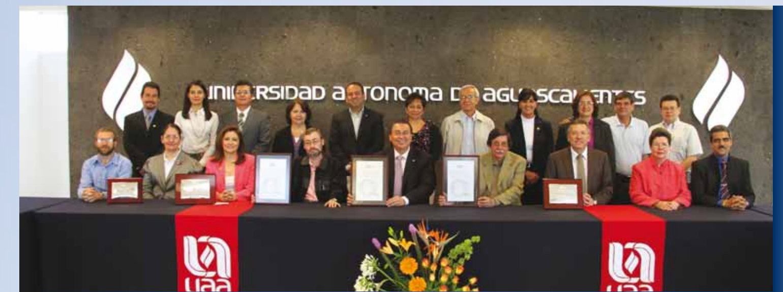
Reconocimiento Internacional a Programas de Posgrado.

El reconocimiento internacional de tres maestrías representa un estímulo importante para los demás programas de posgrado, y un reconocimiento meritorio para los galardonados.