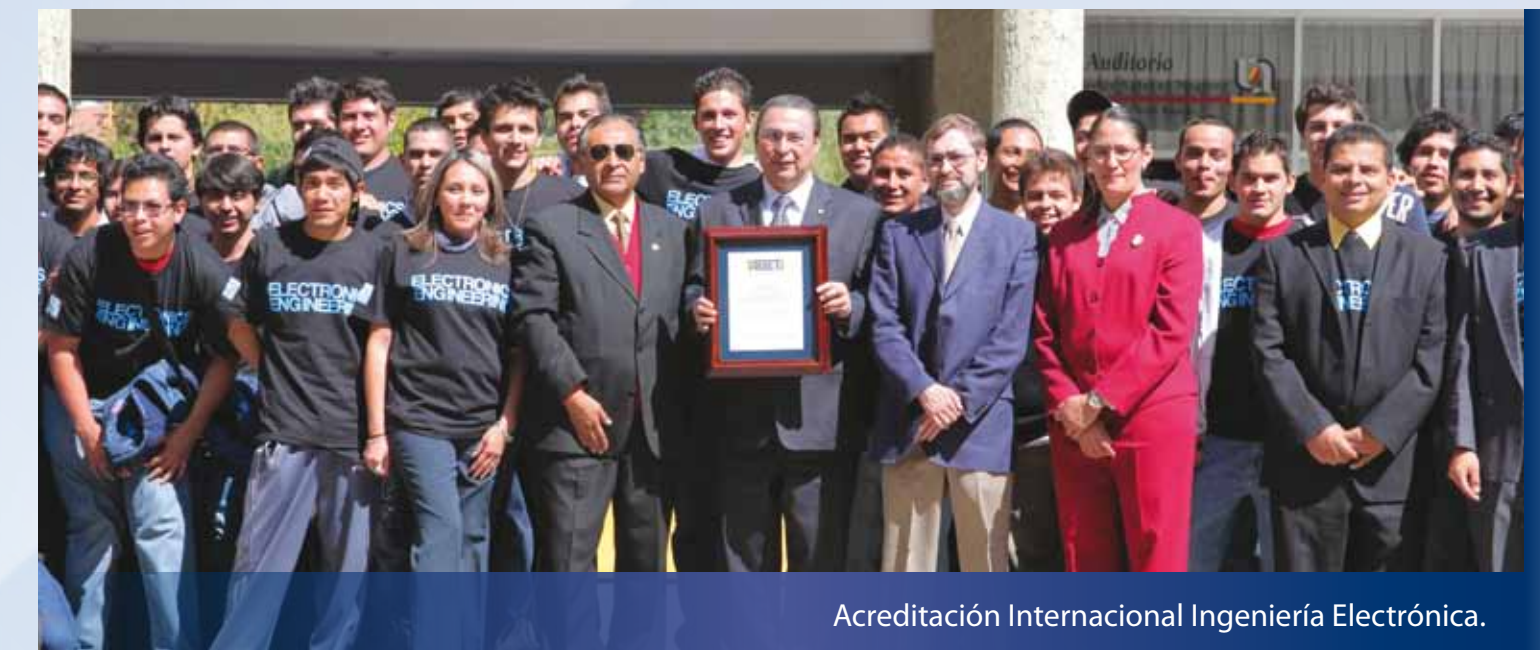
Acreditación Internacional Ingeniería Electrónica.

ESTABLECE EL COMPROMISO POR MANTENER EL NIVEL ACADÉMICO Y POSICIONAR A LA UAA COMO PUNTO DE REFERENCIA NACIONAL.