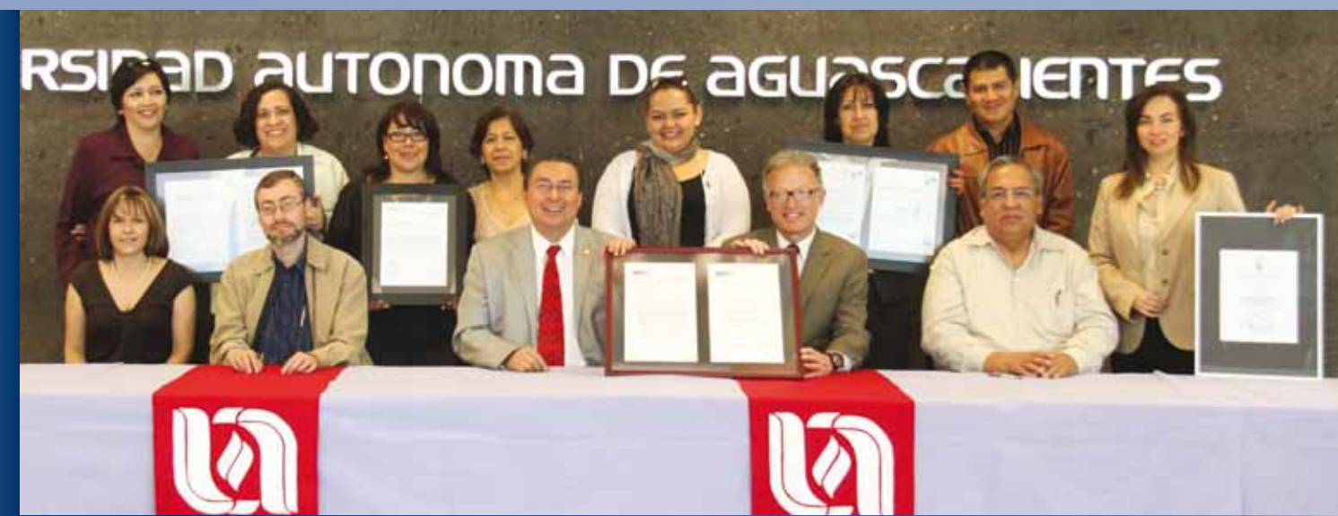
Acreditación Internacional: Ing. Civil, Arquitectura, Urbanismo, Diseño Gráfico, Diseño de Moda y Diseño Industrial.