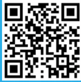
Portal Descubre tu carrera UAA