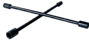
UCL20 Llave De Cruz 17 Mm X 3/4 Pulgadas X 7/8 Pulgadas X 33/16 Pulgadas X 20 Pulgadas Urrea