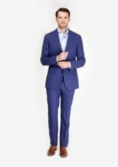
Saco: con solapa en color azul marino Pantalón: corte recto en azul marino