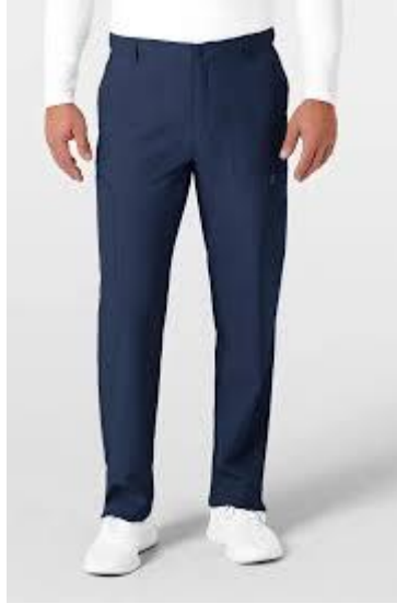
Pantalón 1: de vestir en color azul marino corte moderno