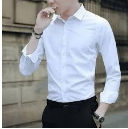
Camisa: manga larga color blanco