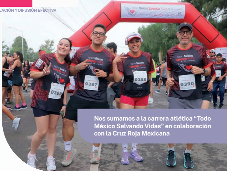
Nos sumamos a la carrera atlética "Todo México Salvando Vidas" en colaboración con la Cruz Roja Mexicana

Realizamos la 30ª edición de la Feria Universitaria, el evento de vinculación institucional más importante, donde logramos ofertar un programa con más de 350 actividades académicas, culturales y recreativas, fortaleciendo nuestro papel como punto de encuentro entre nuestra comunidad y la sociedad. Además de los espacios organizados por los centros académicos, realizamos varias actividades culturales y un espectáculo de drones que narraron la historia de la feria.