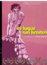
EL LUGAR SIN LÍMITES México 1978