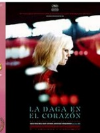
LA DAGA EN EL CORAZÓN Francia 2018

Y, POR PRIMERA VEZ, ABRIMOS UN NUEVO ESPACIO: "AQUÍ ENTRE NOSOTROS...DIÁLOGOS LGTB" 8:00PM A 9:00PM.