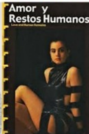
AMOR Y RESTOS HUMANOS Canadá 1993