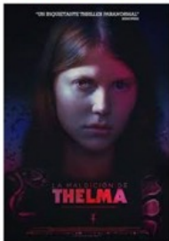
LA MALDICIÓN DE THELMA Noruega 2017