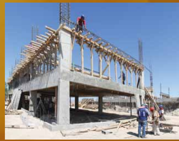
CAMPUS ORIENTE DEL CEM