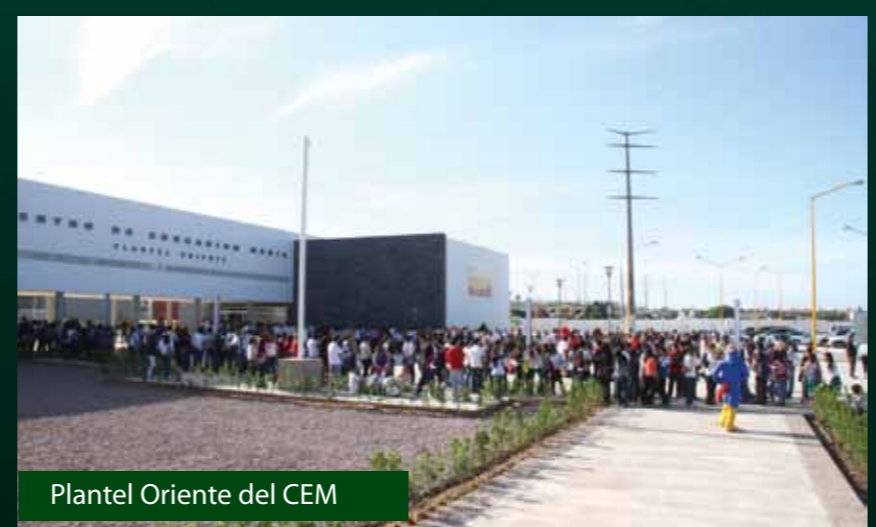
Plantel Oriente del CEM