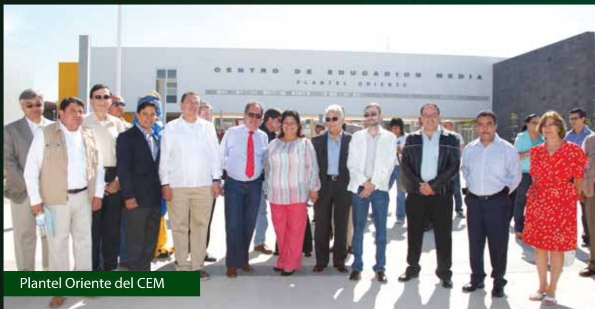
Plantel Oriente del CEM

"Estos proyectos educativos permitirán un mayor crecimiento de la oferta de espacios, pero también activar el círculo del desarrollo industrial, ya que los egresados de las nuevas carreras podrán insertarse en el mercado laboral, dentro de grandes empresas en la entidad".