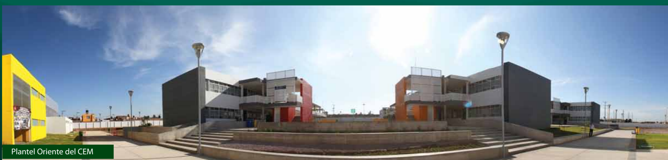
Plantel Oriente del CEM