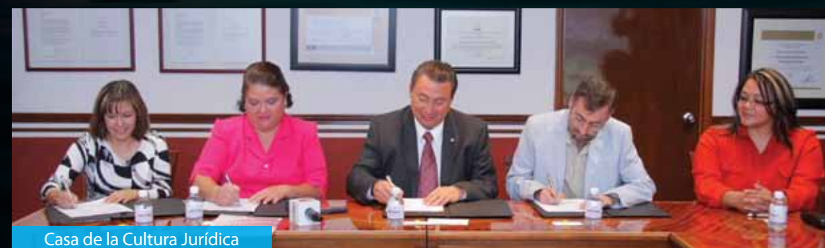
Casa de la Cultura Jurídica