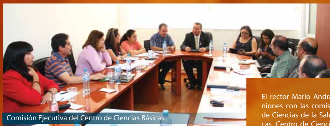
Comisión Ejecutiva del Centro de Ciencias Básicas