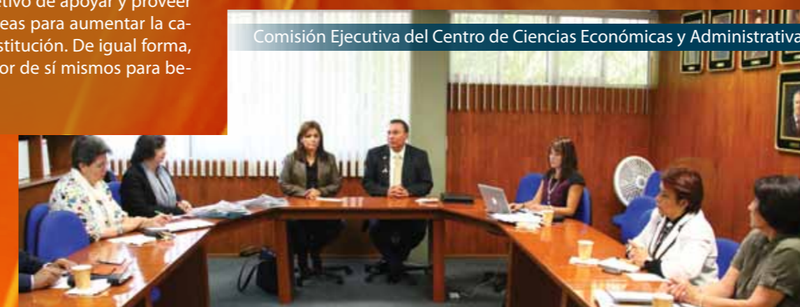
Comisión Ejecutiva del Centro de Ciencias Económicas y Administrativas