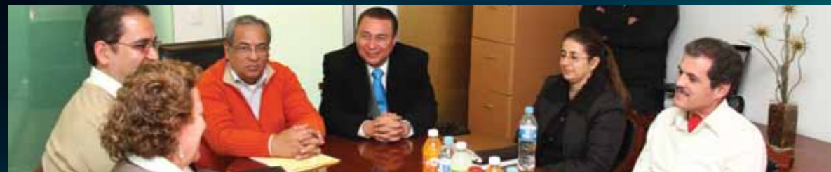
Docencia de Pregrado