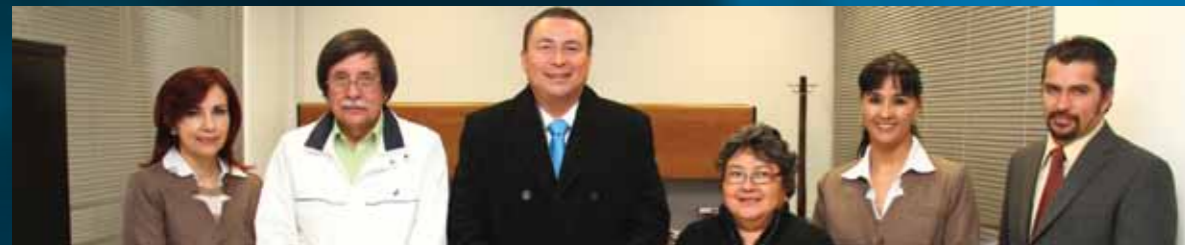
Investigación y Posgrado