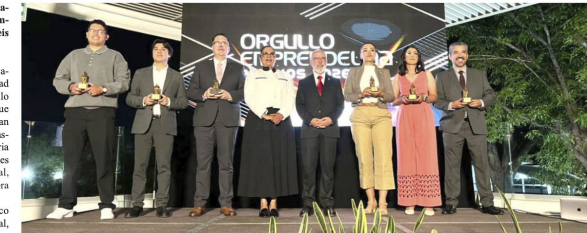
La convocatoria alcanzó las 202 postulaciones, de las cuales 71 iniciativas avanzaron a la etapa final

La jornada incluyó la conferencia magistral de Pepe Villatoro, cofundador de FuckUp Nights, titulada "Cómo convertir el fracaso en un emprendimiento global". En su intervención, compartió su experiencia creando empresas internacionales e invitó