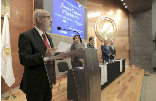
El rector de la UAA destacó que los exalumnos son parte esencial de la vida universitaria y los primeros referentes de la calidad académica

El rector destacó que los exalumnos son la representación de un vínculo directo entre