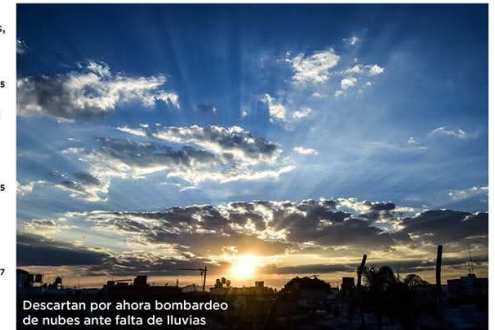
Descartan por ahora bombardeo de nubes ante falta de lluvias

ELIZABETH RODRÍGUEZ 7