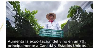
Aumenta la exportación del vino en un 7%, principalmente a Canadá y Estados Unidos