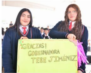
La gobernadora inauguró el Conalep de Villa Juárez y entregó las nuevas instalaciones del Telebachillerato Comunitario de La Gloria