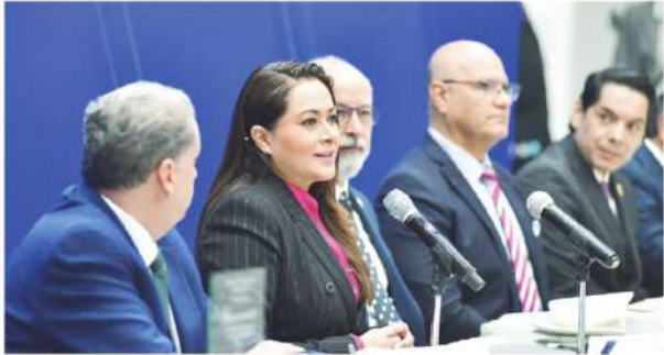
La jefa del Ejecutivo encabezó la Sesión Ordinaria del Sistema Estatal para el Fortalecimiento de la Educación.