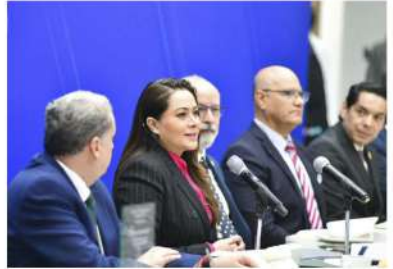
"No se trata sólo de llevar a nuestros niños, niñas y jóvenes a las aulas, sino de asegurar que reciban una educación de calidad, que forme a los mejores y les permita competir a nivel mundial", destacó la mandataria

"La Educación es una Prioridad Absoluta"