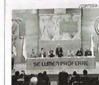
Este evento se realizó para celebrar a las y los profesionales de la Biología

Durante su mensaje, el rector subrayó que la Biología aporta evidencia, método y capacidad de análisis para tomar decisiones mejor informadas en ámbitos como la gestión de los recursos naturales, la salud pública, la producción agroalimentaria, la conservación de especies y el diseño de políticas públicas. Desde esta perspectiva, los temas ambientales y de biodiversidad deben de ser consignas para convertirse en asuntos técnicos, éticos y sociales de primer orden.