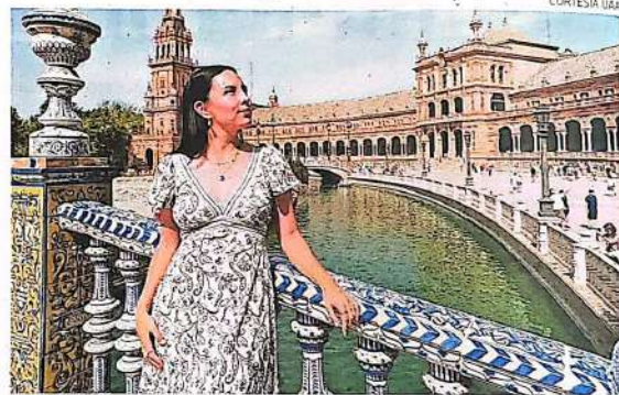
La UAA impulsa una educación fortalecida y visión global

Con el objetivo de seguir impulsando una formación académica integral y con visión global, la UAA mantiene abierta su convocatoria de Movilidad Estudiantil Saliente para el periodo agosto-diciembre de 2026, dirigida a estudiantes de licenciatura e ingeniería interesados en realizar una estancia académica en instituciones de educación superior, tanto nacionales como internacionales. La movilidad académica se ha consolidado como una de las experiencias formativas más significativas para el estudiantado de la UAA. Tan solo en 2025, la institución contó con 201 convenios activos que permitieron a las y los estudiantes cursar parte de sus estudios en universidades de reconocido prestigio dentro y fuera del país. Gracias a estos acuerdos, es posible postularse para realizar estancias en destinos como Alemania, Argentina, Brasil, Colombia, Chile, España, Francia, Italia y Japón, entre otros. A través del DAFI, la UAA invi-