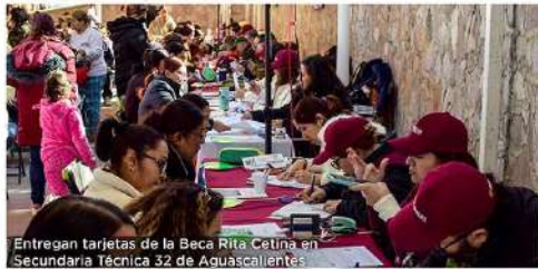
Entregan tarjetas de la Beca Rita Cetina en Secundaria Técnica 32 de Aguascalientes

Alertan por páginas falsas de buses y confirman pagos retroactivos en Aguascalientes