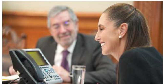
Ciudad de México.- Claudia Sheinbaum platicó unos 40 minutos con Donald Trump