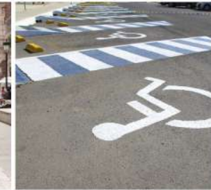
Investigadores de la UAA analizan la dinámica urbana y cambios de uso de suelo que están impactando la vida cotidiana del adulto mayor en el centro de Aguascalientes

para los adultos mayores veríamos que el centro es la zona más envejecida, al igual que la zona norte, Jesús María y Pocitos, y al este descubrimos a la población más joven. Queremos saber cómo viven, por lo que entraremos con otro tipo de estudios".