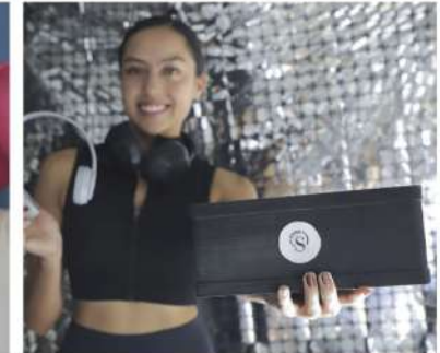
La UAA brindó a sus estudiantes herramientas prácticas para emprender y acercarse a la Incubadora de Empresas