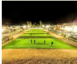
Esto obra representa la primera cancha municipal de Techito Bandera con pasto sintético

Se tiene la continuación de 18 nuevos proyectos de inversión por un monto superior a los 600 millones de dólares y la generación de 8 mil nuevos empleos formales, anunció la gobernadora