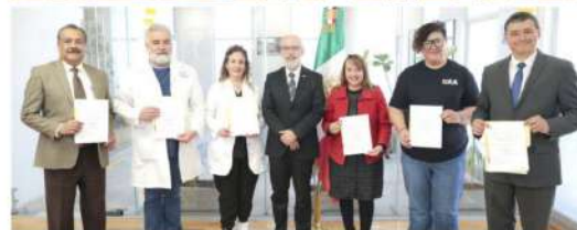
Las y los nuevos jefes de departamento iniciarán funciones el 16 de febrero, tras un proceso de análisis de perfiles y proyectos alineados a las necesidades académicas de cada área

el desarrollo de sus funciones e hizo un llamado a impulsar actividades académicas y de vinculación, invitandoles a participar activamente en ellas como parte del fortalecimiento de cada departamento.