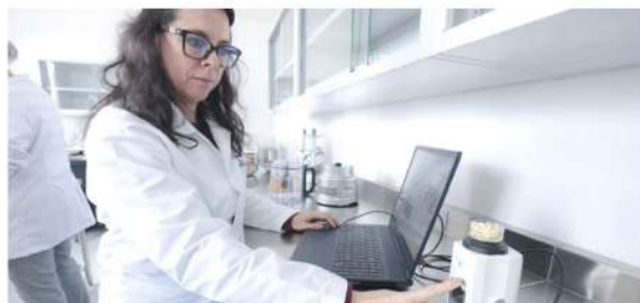
El conocimiento que se genera en la Universidad puede convertirse en soluciones prácticas para la comunidad.

Uno de los principales beneficios de estos servicios es que se ofrecen a costos accesibles, mucho menores a los que normalmente se encuentran en el mercado, sin dejar de lado la calidad y el profesionalismo que distinguen a la Autónoma de Aguascalientes. De esta forma, la UAA facilita el acceso a servicios especializados y, al mismo tiempo, consolida su función de vinculación con la