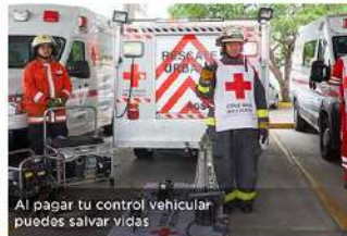
Al pagar tu control vehicular puedes salvar vidas

CON INFORMACIÓN NACIONAL E INTERNACIONAL DE apro