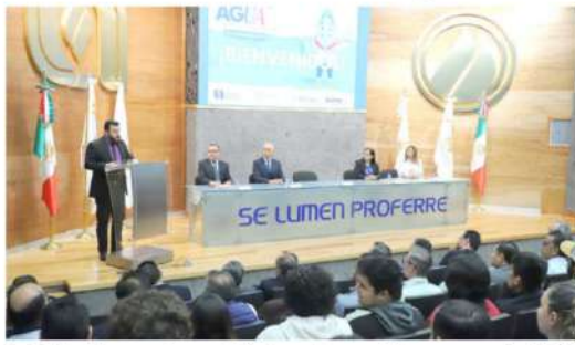
La UAA recibe a expertos y autoridades en el marco de la conmemoración del Día Mundial del Agua establecido por la ONU

"La UNESCO afirma que la mitad de la población enfrenta problemas de escasez de