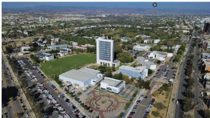
En próximos días se realizará otra audiencia contra presuntos implicados en la Estafa Ponzi

Por ahora, los dos presuntos implicados que fueron detenidos se quedarán en prisión preventiva