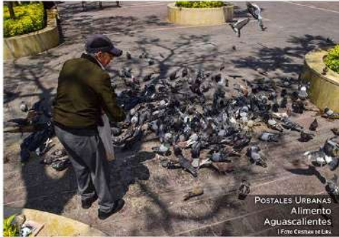
POSTALES URBANAS Alimento Aguascalientes

Abren registro de pensión para personas con discapacidad de 0 a 29 años en Aguascalientes