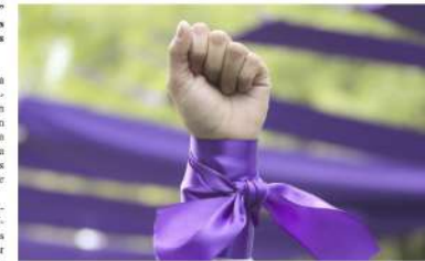
La jornada se desarrollará del 3 al 26 de marzo en Campus Central y Campus Sur las mujeres.

La iniciativa, que surge de la sinergia entre la Dirección General de Vinculación, diversos centros académicos, la Red Universitaria de Mujeres (RUM) y el Centro