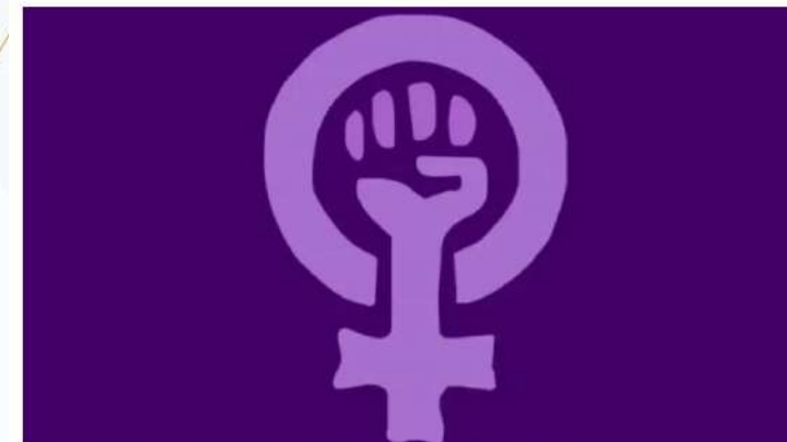
El 8M, reconocido como el día internacional de la mujer desde 1975 por la ONU

Forman parte de las actividades del Centro de Ciencias Sociales y Humanidades