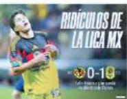
RIDÍCULOS DE LA LIGA MX