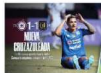
LA NUEVA CRUZAZULEADA