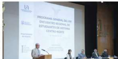
Con un programa que incluye más de 20 mesas de trabajo y actividades académicas, la UAA fortalece la formación de estudiantes de historia y el diálogo interinstitucional en la región.

A estas actividades se suman tres congresos enfocados en historia de las mujeres, reflexiones contemporáneas y disidencias, así como talleres que exploran diversas líneas de análisis, entre ellas filosofía e historia, migraciones, memoria, archivos, cultura escrita, artesanía, arqueología, arte y estudios sobre la muerte. De igual forma, se presentan exposiciones fotográficas realizadas por estudiantes, en las que