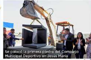
Se colocó la primera piedra del Complejo Municipal Deportivo en Jesús María