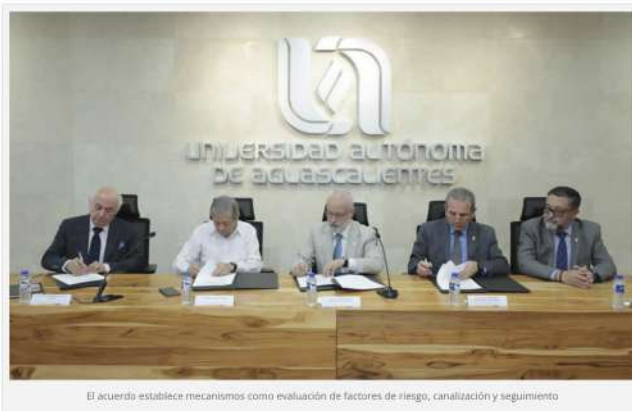
El acuerdo establece mecanismos como evaluación de factores de riesgo, canalización y seguimiento

Para Fortalecer Atención, Prevención y Seguimiento