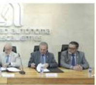
El acuerdo establece mecanismos como evaluación de factores de riesgo, canalización y seguimiento.

El acuerdo establece mecanismos como la evaluación periódica de factores de riesgo en la población estudiantil, la canalización oportuna de casos que requieran atención especializada, así como la implementación de un sistema de referencia y contrarreferencia que permita dar seguimiento continuo, responsable y puntual. Además, el convenio