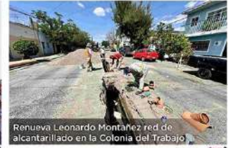
Renueva Leonardo Montaña red de alcantarillado en la Colonia del Trabajo

CON INFORMACIÓN NACIONAL E INTERNACIONAL DE apro