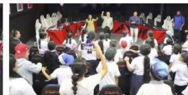
Desde temprana edad, la UAA orienta e inspira vocaciones, demostrando que estudiar permite transformar vidas y comunidades.

La Universidad Autónoma de Aguascalientes se llenó de mucho entusiasmo al recibir a niñas y niños de la Escuela Primaria Justo Sierra, quienes recorrieron distintos espacios institucionales con el propósito de que desde hoy imaginen su futuro y descubran que la educación es el camino para lograrlo.