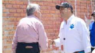
El alcalde visitó a los habitantes de la colonia Miravalle para escuchar y atender las necesidades e inquietudes de este sector de la ciudad

"Con los Pobres de la Tierra..." Por Espigazón Rivera