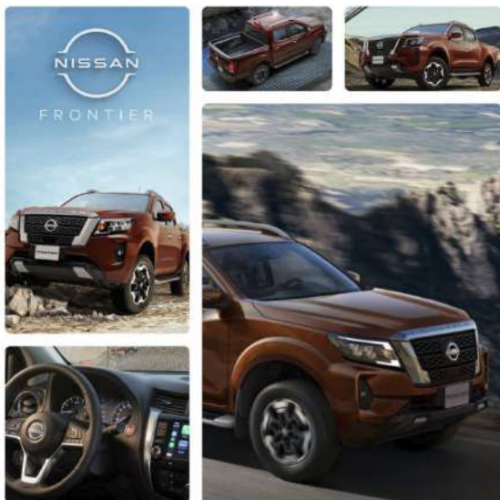
Este miércoles se llevó a cabo la salida conmemorativa de la primera unidad Nissan NP300/Frontier, hecho que marca un nuevo capítulo en la evolución industrial automotriz del estado y del país.