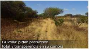
La Pona: piden protección total y transparencia en su compra

KARLA LINARÉ AVILA GARCÍA, ELIZABETH ROSALES Y STAFF 5