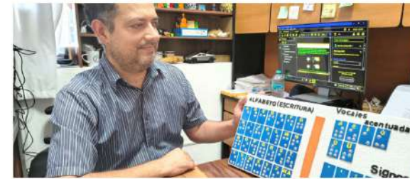
La máxima casa de estudios del estado ha logrado, hasta el mes de marzo de 2026, el registro oficial de 11 programas de cómputo ante el Instituto Nacional del Derecho de Autor (Indautor)

La producción tecnológica de la UAA incluye soluciones con un alto sentido humano, como programas de gamificación para la enseñanza del sistema de colaboración con el DIF Estatal, y aplicaciones móviles.