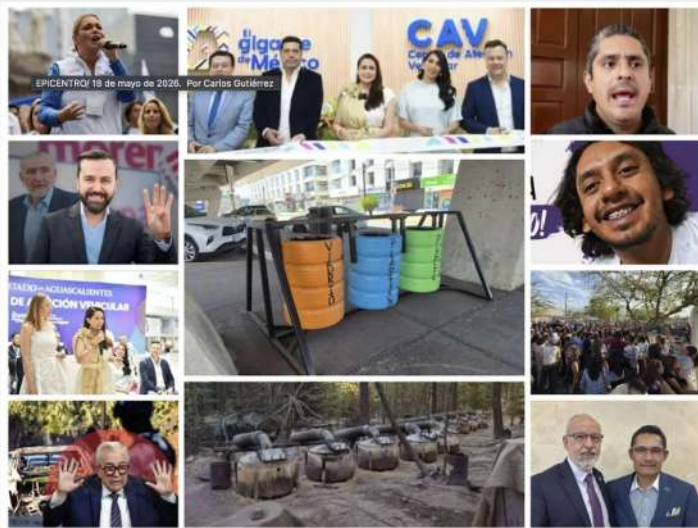
EPICENTRO/ 18 de mayo de 2026. Por Carlos Gutiérrez