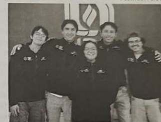
Estudiantes de la UAA destacaron en el Talent Land México 2026

A lo largo de tres días de trabajo, los estudiantes desarrollaron "Tomin", una aplicación móvil concebida como asesor financiero digital para apoyar a nuevos usuarios, especialmente jóvenes, a mejorar la gestión de sus recursos. Esta herramienta permite analizar ingresos y egresos, generar pronósticos financieros y ofrecer recomendaciones personalizadas. Además, incluye un asistente inteligente que responde a dudas sobre gastos, así como módulos de aprendizaje gamificados para fomentar hábitos financieros saludables.