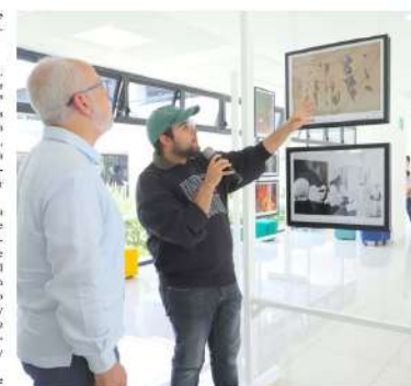
La próxima edición de la copa abordará el tema "Cultura de paz en un mundo convulso"; la convocatoria permanecerá abierta hasta octubre de 2026

Destacó también la calidad del trabajo presentado por estudiantes de la UAA, institución que históricamente ha obtenido selecciones y reconocimientos dentro del certamen. Finalmente, invitó a la comunidad estudiantil a participar en la próxima convocatoria, la cual permanecerá abierta