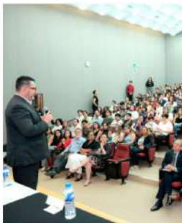
Expertos coinciden en que la paz social comienza con la conexión individual y el compromiso con los valores fundamentales

El Ikigai es un concepto utilizado en la cultura japonesa que se traduce como "razón de ser". Representa la intersección entre lo que uno ama, aquello en lo que se es bueno, lo que el mundo necesita y por lo que se puede recibir una retribución; una filosofía de vida para encontrar el equilibrio, propósito