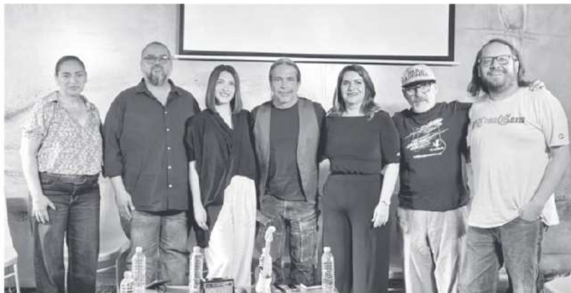
Sergio Vallín, guitarrista de Maná, presente en el evento del IMAC.