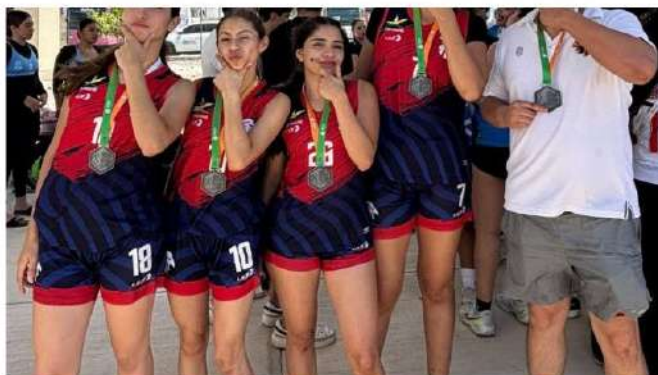
Aguascalientes suma dos Medallas de Plata en los Juegos Nacionales Escolares

📅 mayo 20, 2026 📍 El Látigo Digital 📂 Deportes 🗣️ 0