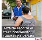
Alcalde recorre el fraccionamiento Guadalupe Peralta. Pág. 9