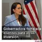
Gobernadora fortalece alianzas para atraer inversión. Pág. 9