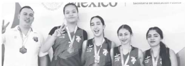
SECRETARÍA DE EDUCACIÓN Y FOMENTO

La delegación aguascalentense está integrada por 266 deportistas de varias instituciones de educación media.