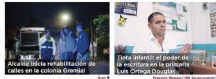
Alcalde inicia rehabilitación de calles en la colonia Gremial