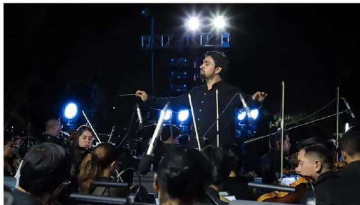
Con esta presentación, celebrará 15 años de su creación

Con este concierto, la UAA celebra 30 años de Polifonía Universitaria y el 15° Aniversario de la OFUAA