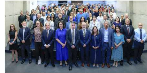
El encuentro fortaleció los vínculos de colaboración entre la UAA y la comunidad diplomática internacional

Los asistentes conocieron de primera mano una experiencia internacional reconocida por sus aportes a la resolución de conflictos.