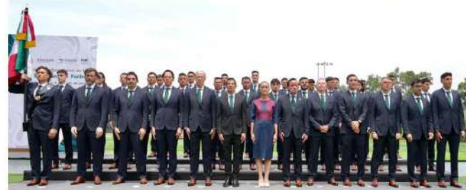
Claudia Sheinbaum, la Jefa del Ejército Federal Mx entrega de la Bandera Nacional a Guillermo Ochoa, quien representó a las 26 selecciones nacionales, así como el cuerpo olímpico