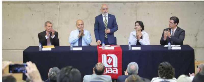
El Programa Interinstitucional del Doctorado en Arquitectura (PIDA) destaca como un esfuerzo entre universidades para impulsar la formación de investigadores de alto nivel

Cabe destacar que el PIDA cuenta con reconocimiento nacional e internacional, y está respaldado por una plantilla docente conformada por investigadores del Sistema Nacional de Investigadoras e Investigadores (SNI). A lo largo de su trayectoria, ha formado a varias generaciones, lo que evidencia su contribución al desarrollo académico y disciplinar de la arquitectura en México.