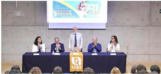
Los jóvenes investigadores de la institución colaborarán en proyectos científicos con universidades de México, Colombia, Costa Rica y Nicaragua

Los alumnos de la UAA realizaron estancias presenciales y virtuales del 8 de junio al 24 de julio en algunas instituciones del país, así como de Colombia, Costa Rica y Nicaragua.