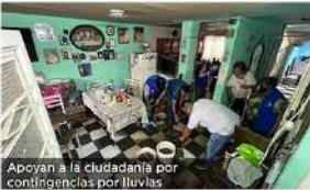
Apoyan a la ciudadanía por contingencias por lluvias

CON INFORMACIÓN NACIONAL E INTERNACIONAL DE CIPRO