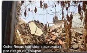
Ocho fincas han sido clausuradas por riesgo de colapso